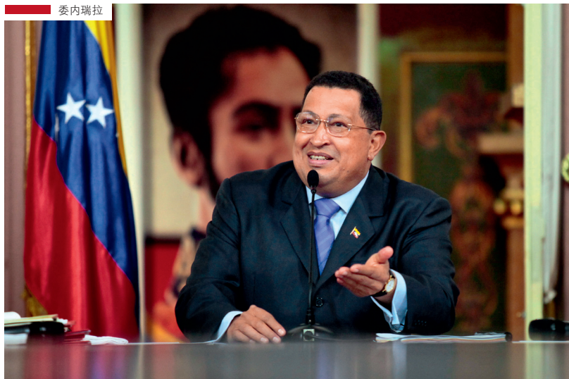
10月13日，委内瑞拉总统查韦斯和新内阁成员参加在总统府举行的宣誓仪式

“查韦斯的演讲极具感染力，人们都相信他将为自己而战。演讲中他既总结了已有成绩，又使民众对未来满怀憧憬——定期的健康检查、下降的食品价格、正在建设的新住所等。人们感受到了‘我就是下个受益者’的希望。”智库机构“美洲对话”高级研究员彼得·哈基姆告诉本刊。美国莱斯大学政治学系教授马克·琼斯也向本刊指出：“查韦斯在贫民和工人阶层中非常受欢迎，他是他们心目中能为自己提高生活质量的救世主。”中国社会科学院拉美研究所研究员王鹏认为：“查韦斯执政期间高度关注下层居民的利益。无论他的政策存在何种争议，他的政府为基层民众花钱的胆量和决心是显而易见的。在下层居民占全体选民的大多数的国家，得到他们的支持就可赢得选举。卡普里莱斯的劣势在于没有拿出一套可以替代查韦斯路线的施政方针来打动选民。”