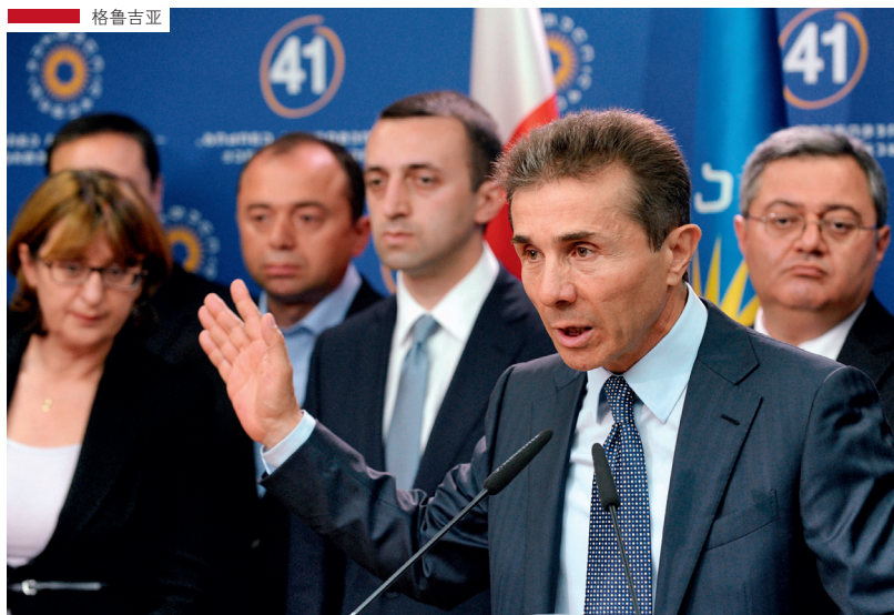
10月8日，伊万尼什维利在格鲁吉亚首都第比利斯正式公布了新一届内阁候选人名单

伊万尼什维利是在俄罗斯发家致富的。选举后，萨卡什维利警告说“格鲁吉亚梦想”会使国家与西方世界疏远并回到俄罗斯的影响之下，可伊万尼什维利承诺要加快格鲁吉亚民主化制度发展以融入北约，并称将在美国大选结束后立即访美。丹尼斯·邓恩说：“他会延续萨卡什维利与西方的紧密联系，但不同的是，新政权会以更平衡的方式对待俄罗斯，将其放入提高国民生活水平、巩固主权与国土安全的考量中。”丛鹏指出：“伊万尼什维利认为前政权在外交方面是失败的，他能认识到俄罗斯的重要性，所以更加面面俱到。格鲁吉亚的地理位置虽然关键，但从2008年俄格冲突的经验看，美国和北约在关键时刻并不会直接采取强硬干预。我想伊万尼什维利若在明年当选总统，他很可能采取亚美尼亚和阿塞拜疆的做法，推行多元化的平衡外交，与西方和俄罗斯同时发展关系。”